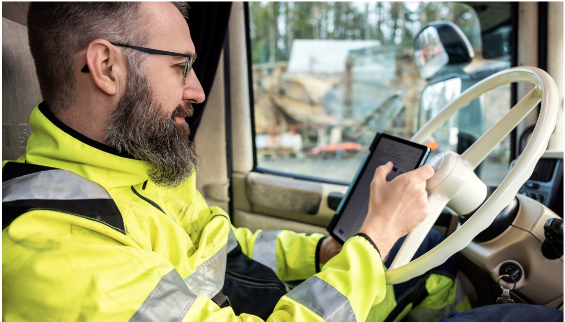
Hogia Moveit förenklar och automatiserar administration för våra kunder.

områdena Ekonomi, HR eller via partners erbjuder vi våra kunder i Sverige och Norge ett komplett administrativt flöde. Vi samarbetar tätt med branschorganisationer och ligger i teknisk framkant genom att tillhandahålla integrerat stöd för de standardiserings-, myndighets- och rapporteringskrav som ställs på våra kunder.