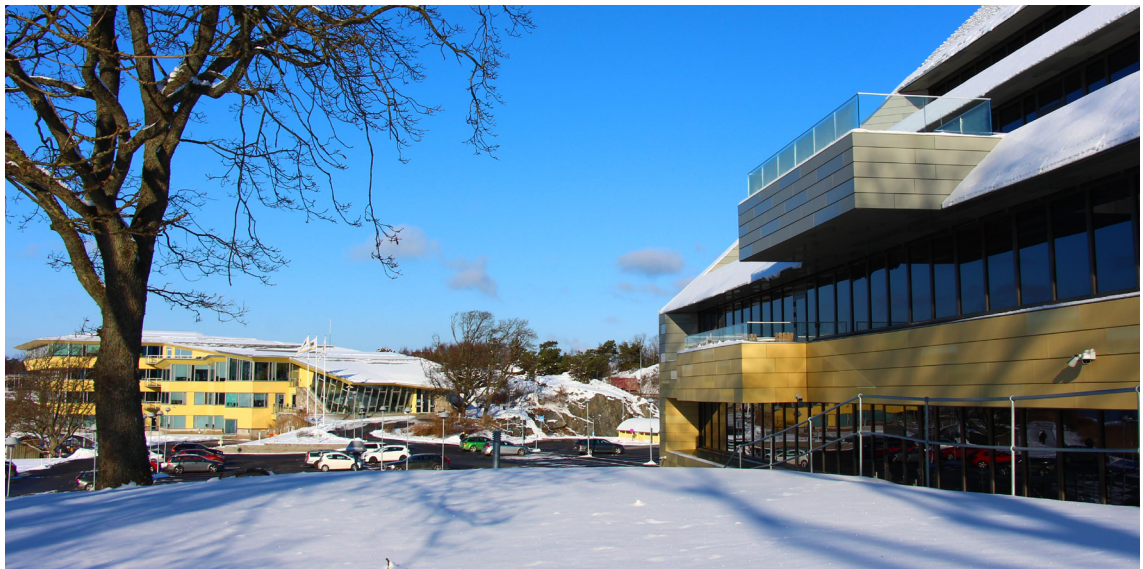
Hogias huvudkontor vid Hakefjorden i Stenungsund.

Hogia AB, som under 2022 avverkade det 42:a verksamhetsåret, är moderbolag i en koncern som består av ca 30 helägda företag i Norden och Storbritannien. Den operativa verksamheten i koncernen bedrivs i dotterbolagen till Hogia AB. Externt benämner vi ofta koncernen som "Hogia-gruppen".